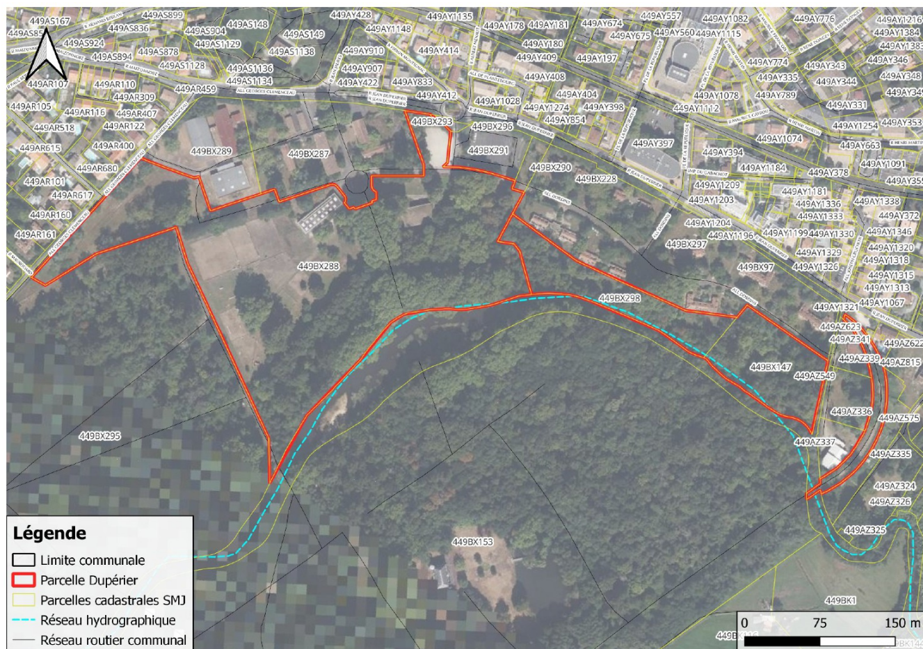
Figure n°5 : Plan cadastrale de la parcelle Dupérier

Au Plan Local d'Urbanisme (PLU), ces parcelles sont aujourd'hui classées majoritairement en zonage N (Naturel) et zonage U (Urbanisable) pour les parties situées en lisière urbaine. Les parcelles sont également concernées par le Plan de Prévention du Risque Inondation (PPRI).