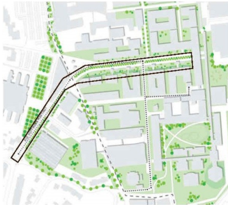
Périmètre des études de maîtrise d'œuvre

Ce projet d'aménagement répond à l'ambition de proposer un cadre de travail et d'étude agréable et accessible à tous, de penser la mixité des fonctions et des usages et d'intégrer des critères de qualité urbaine, architecturale et paysagère sur ce site.