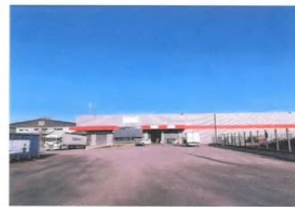
Bâtiment d'activités neuf