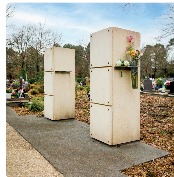
Columbarium pour 2 urnes