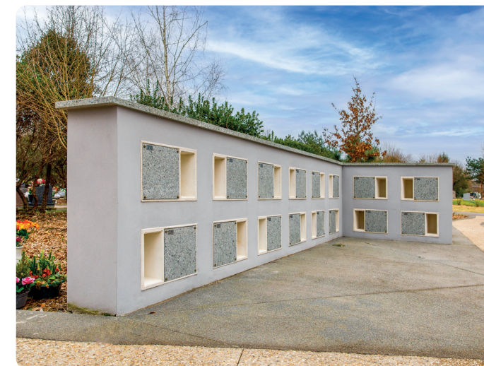
Columbarium pour 4 urnes