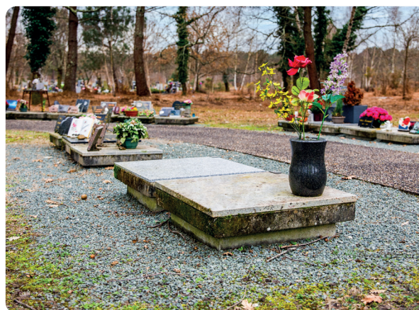
Caveau cinéraire pour 10 ans