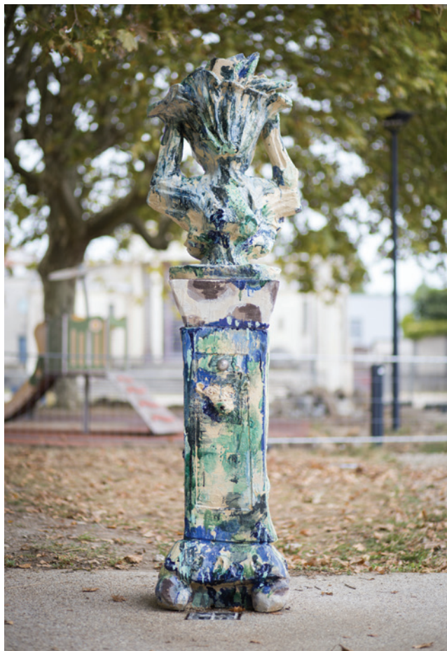
PLACE ADOLPHE BUSCAILLET, LA FONTAINE À BOIRE

Clémence van Lunen Barbara Bauer et Bulbul La Nouvelle Agence, Bordeaux Bordeaux Métropole