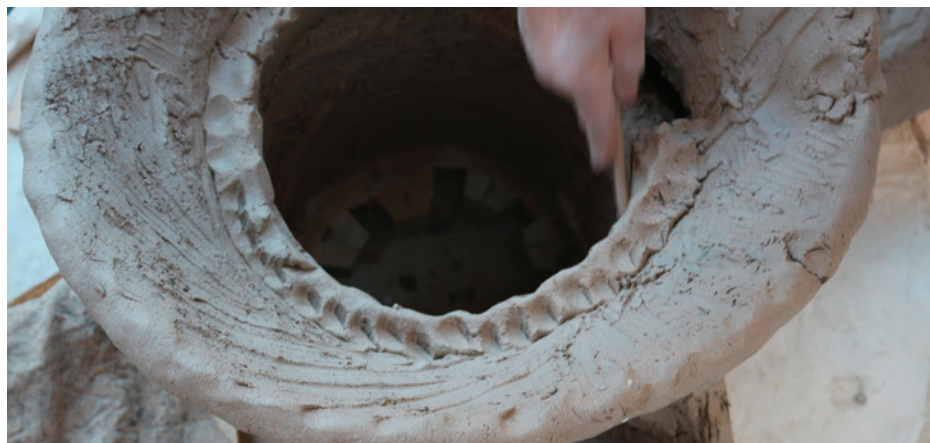
© Barbara Bauer et Jacques Bieham